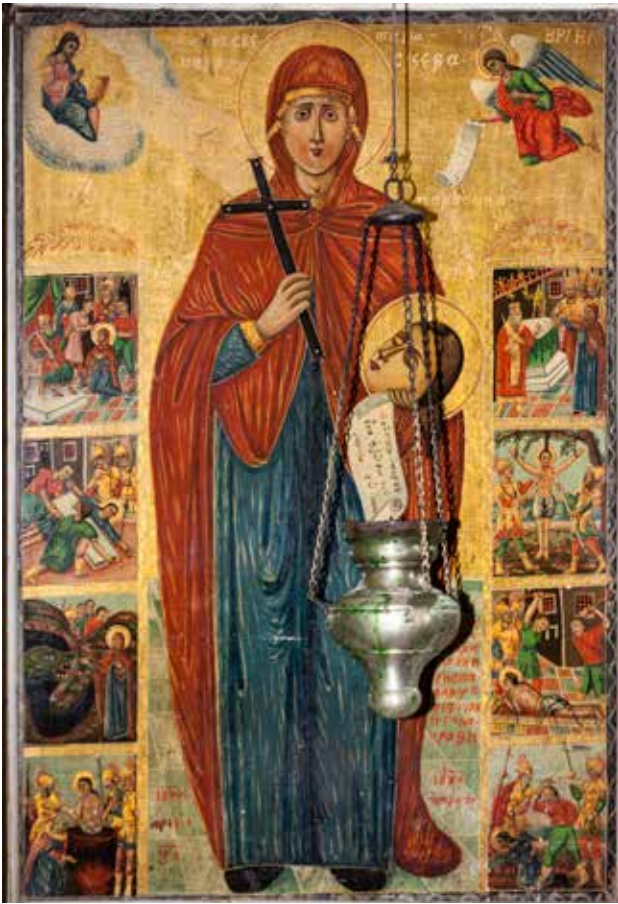
Сл. 7. Житијна икона на Св. Параскева, црквата Св. Никола во село Врбен

светител на трон. Нечиток приложнички текст испишан под нозете на светителот. На долната половина на иконата, во средното поле насликан е Христос како од сегмент на небо го благословува Св. Мина на коњ СТЫН МННА / мина. На десната долна половина на иконата насликан е Св. Василиј на трон СТЫН ВАСНЛА / о αγιος βασιλειος д.с.: приложнички натпис и автограф под нозете на св. Василиј: ΡΥΚΥ ΧΑΙΤΗ ΑΝΑΓΝΩΣΤΗ ΠΑΡ..... ΗΠΥΣЦЬ ЯПРНАКΩЦО / ... / ЯСНДА (рег. бр. 9003, дим. дим. 103x95x3 см.) (сл. 8)