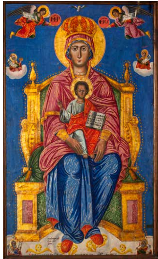
Сл. 18. Богородица со Христос, црквата Св. Архангел Михаил во с. Кракорница

д.д.: РЪКЪ ХАЧН АНГНѠС/ТН АѠМЪ 1843 / δια χειρος ἡ αναγνωστῆς σελτοβχριος (рег. бр. 9053, дим. 94x60x2,5 см.) (сл.15); Исус Христос ἸϞ̅ Χ̅ς ΙΗΣΥΣ̅ ΧΡΙ̅ΣΤΟΣ̅, текст на отворениот кодекс во рацете на Христос: АЗЪ ЕС/ МЪСВ/ ЪТ Ъ/ МНРЪ/ ХОДА/ НПО/ МНЪ/ НЕНСМ/ АТЬ, Х/ ОДНТ. г.л.: Текст на от- вореното евангелие Јован / СЪЫН ΙΩΑΝΝ̅Σ̅ Θ̅Ε̅Ο̅Λ̅Ο̅Γ̅Ο̅ : Ρ̅Ε̅Υ̅Ε̅ / Γ̅Ε̅Δ̅Ъ̅ С̅ / Β̅Ο̅Ν̅Ι̅Μ̅ / Ъ̅ Ο̅Υ̅Χ̅ / Ε̅Ν̅Η̅Κ̅Ω̅ / Μ̅ Β̅Σ̅Ι̅ / Σ̅Ε̅Ъ̅ Τ̅; г.д: Текст на отвореното евангелие кај Матеј СЪЫН ΜΑΤ̅Θ̅Ε̅Ο̅Σ̅ : Α̅Ζ̅Ъ̅ Ε̅ / Μ̅Σ̅ С̅ / Β̅Ε̅Τ̅ / Ъ̅ Μ̅ / Ι̅Ρ̅Α̅Π̅ Ο̅Σ̅Λ̅Ъ̅ / Δ̅Υ̅Α̅η̅ / Μ̅Η̅Ъ̅. приложнички натпис д.л.: Η̅Ζ̅ Δ̅Η̅Β̅Ε̅Ν̅Ι̅Ε̅Μ̅Ъ̅ Ρ̅Α̅Β̅Я̅ Β̅Ο̅Ж̅Ι̅А̅ / Α̅Ρ̅Σ̅Ε̅Ν̅Ъ̅ Ρ̅Α̅Δ̅Η̅Ч̅Н̅ / Α̅Ѡ̅М̅Г̅. д. д.: РЪКЪ ХАЧН АГНА/ НОСТН АѠМГ ѠКТОВР/ КѠСЪ. (рег. бр. 9054, дим. 94x60x2,5 см.) (сл. 16); Св. Горги СЪАИН ВЕЛНКОМЪННКЪ ГЕѠРГИН, приложнички натпис д.л.: Η̅Ζ̅ Δ̅Η̅Β̅Ε̅Ν̅Ι̅Ε̅Μ̅Ъ̅ Ρ̅Α̅Β̅Я̅ Β̅Ο̅Ж̅Ι̅А̅ С̅Η̅Ν̅Α̅Ν̅Δ̅Η̅/ Β̅Ε̅Λ̅Α̅Π̅Σ̅Κ̅Ъ̅ Φ̅Ρ̅Ε̅Ν̅Ц̅Ο̅/, д.с.: Α̅Ѡ̅М̅Г̅ Σ̅Ε̅Μ̅Τ̅Ι̅Β̅Ε̅Ρ̅Η̅С̅Ъ̅ 25., д.л.: РЪКЪ ХАЧН/ АГНАОСТН .0 (рег. бр. 9056, дим. 94x60x2,5 см.); Архангел Михаил ја одзема душа- та на богатиот СЪАИН АРХ АГГЛЪ МНХАНАЪ, текст на отворениот свиток: Г̅Α̅Β̅Η̅С̅Ω̅ Ε̅С̅ ... / Κ̅Ω̅ Σ̅Τ̅Ο̅Υ̅ Β̅Ο̅/ Ѡ̅Ρ̅Χ̅Ж̅Ε̅Ν̅ Ы̅Н̅ З̅ / Ρ̅Α̅ Β̅Ε̅Σ̅Ε̅Λ̅Ι̅Ε̅Μ̅ / Ъ̅ Δ̅Ο̅Β̅Ρ̅Ο̅ Τ̅. Β̅Ο̅Ρ̅Α̅Σ̅Σ̅Ι̅Α̅ С̅ / Λ̅Υ̅Α̅ Ж̅Ε̅ Ο̅ / Υ̅Ε̅Ν̅Β̅Α̅Ю̅ С̅Η̅ / Μ̅Ъ̅ Μ̅Ε̅С̅Ε̅Μ̅Ъ̅/ проδύλον