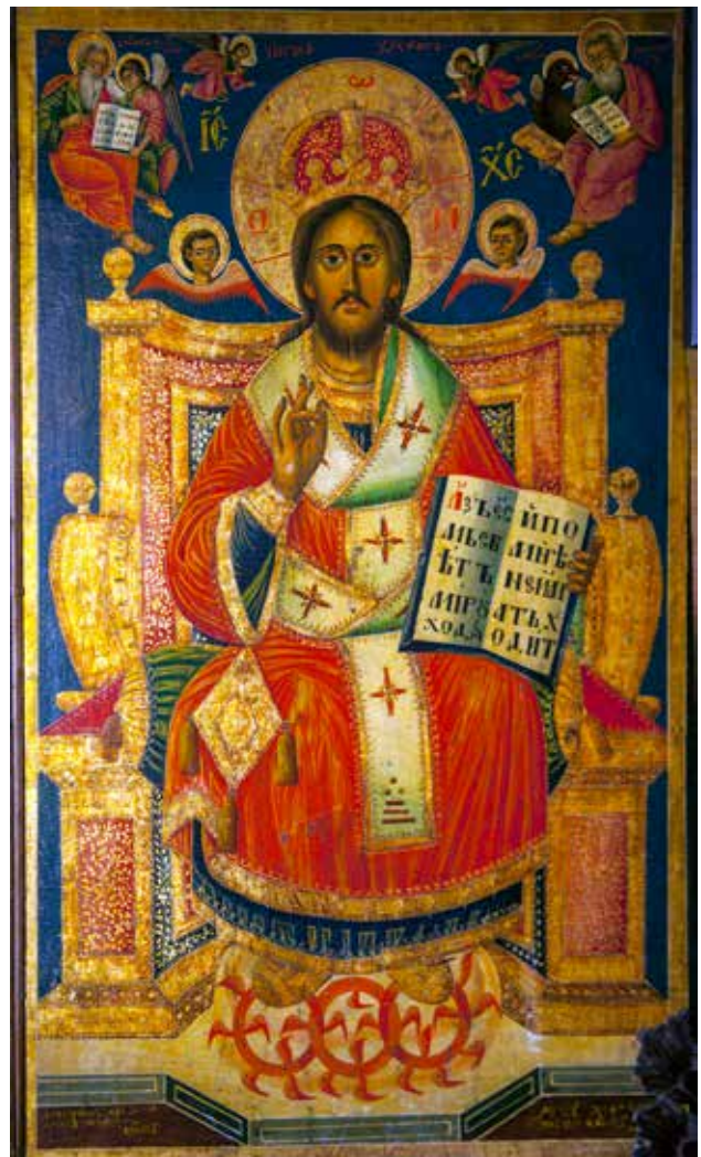
Сл. 16. Исус Христос, црквата Св. Атанасие во селото Ничпур

на св. Јован Крстител; На десната долна половина насликани се сцените: св. Јован Претеча проповеда и го најавува Христос и сцената Усекованието на главата на Јован Крстител; д.с., приложнички натпис: АСМГ ЧЕПОКМОСЪ СН.НЪ ДЯ / МОНЪОВН / РЪКУ ХАЦН / АГНАНОС / ТН ПАРАСКЕВА : СЖКОВРІС\ 10. (рег. бр. 9051, дим. 94x60x2,5 см.) (сл. 13); Св. Атанасиј Велики СТЫН АΘΑΝΑΣΙΩ ΒΕΛΗΚΙΩ / ο αγιος αθανασιος αλεξανδριας / πτυει νε / χης, текст на отворениот кодекс: ΡΕΥΕ / ΓΕΔЪ / СВО / НМ / \ΟΥЧ / ΗΚΟΩ / ΜЪ / ΒΥΕ. Г.л.: Свиток во рацете на ангелот: Χειρε τх χριστх / αθανασιος. приложнички натпис д.л.: НЖДНВЕНІЕМЪ / РАБА БОЖІА / ПЕТКО МЕНКОСЪ / АСМГ. д.д.: РЪКУ ХАЧН АГ / НАНОСТН АСМГ / СЖКОВРІС\ (рег. бр. 9052, дим. 94x60x2,5 см.) (сл. 13); Богородица со Христос со пророци, г.л.: пророк Арон АΡΟΝ\ насликан како држи гранче во едната и отворен свиток во другата рака: ΔΥΧЪ ΓΔΨΝΑ ΝΑΜΗ / Α, НМ НЕПОМЪ..., г.д.: пророк Исаија ΠΡΟΦΟΚ ΙΣΑΙΑ насликан како држи жар во едната и отворен свиток во другата рака: Α ΗСНЛЯ ГДΨНА С / СЕНН ΜΙΑ ΑΣЪ ΕСΜ\, приложнички натпис д.л.: НЖДНВЕНІЕМЪ РАБА БОЖІА / ΑΡΣΕΝЪ ΡΑΔНЧЪ АСМЗ / СЕМΤΕΒΡΗΣΩΣ Α.Σ.