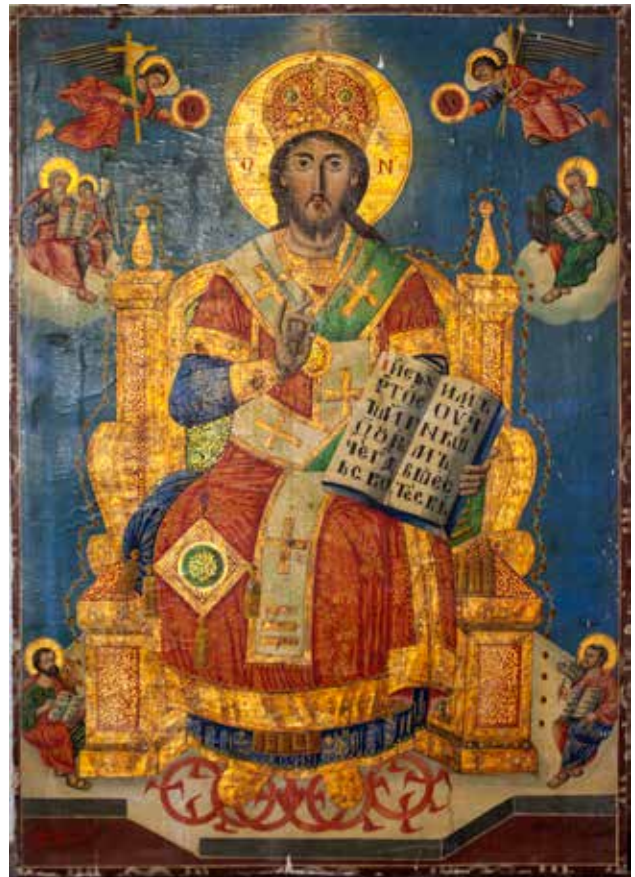
Сл. 24. Исус Христос, црквата Св. Димитрија во село Богдево