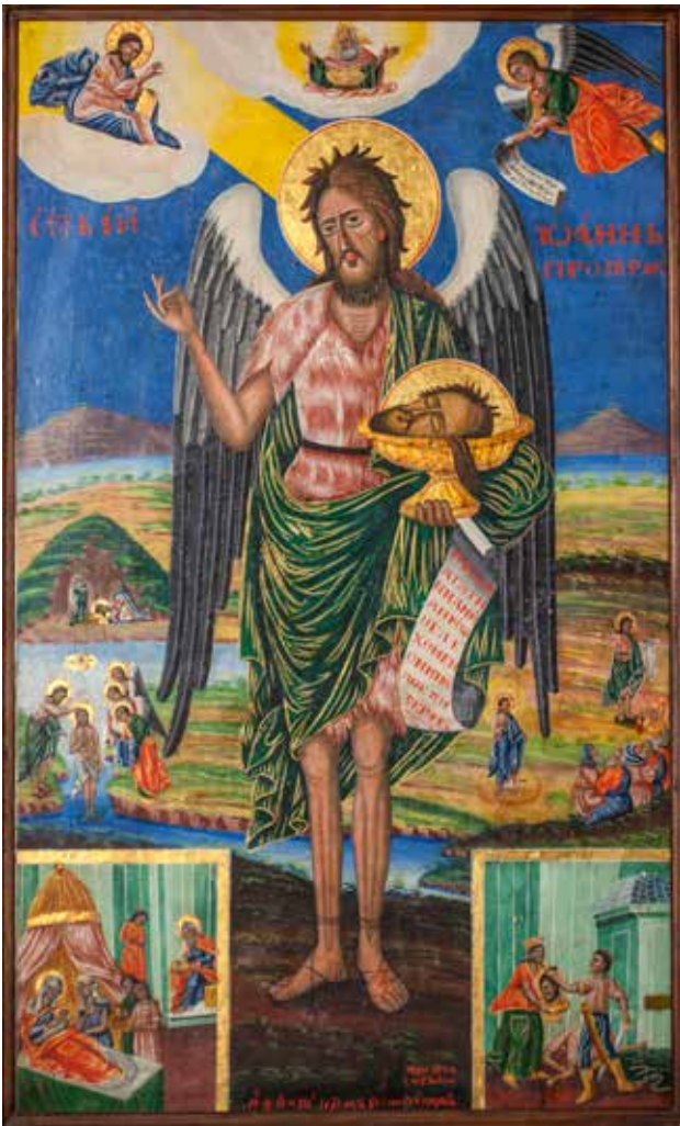
Сл. 17. Јован Крстител, црквата Св. Архангел Михаил во с. Кракорница

д.д.: РЪКЪ ХАЧН АНГНѠС/ТН АѠМЪ 1843 / δια χειρος ἡ αναγνωστῆς σελτοβχριος (рег. бр. 9053, дим. 94x60x2,5 см.) (сл.15); Исус Христос ἸϞ̅ Χ̅ς ΙΗΣΥΣ̅ ΧΡΙ̅ΣΤΟΣ̅, текст на отворениот кодекс во рацете на Христос: АЗЪ ЕС/ МЪСВ/ ЪТ Ъ/ МНРЪ/ ХОДА/ НПО/ МНЪ/ НЕНСМ/ АТЬ, Х/ ОДНТ. г.л.: Текст на от- вореното евангелие Јован / СЪЫН ΙΩΑΝΝ̅Σ̅ Θ̅Ε̅Ο̅Λ̅Ο̅Γ̅Ο̅ : Ρ̅Ε̅Υ̅Ε̅ / Γ̅Ε̅Δ̅Ъ̅ С̅ / Β̅Ο̅Ν̅Ι̅Μ̅ / Ъ̅ Ο̅Υ̅Χ̅ / Ε̅Ν̅Η̅Κ̅Ω̅ / Μ̅ Β̅Σ̅Ι̅ / Σ̅Ε̅Ъ̅ Τ̅; г.д: Текст на отвореното евангелие кај Матеј СЪЫН ΜΑΤ̅Θ̅Ε̅Ο̅Σ̅ : Α̅Ζ̅Ъ̅ Ε̅ / Μ̅Σ̅ С̅ / Β̅Ε̅Τ̅ / Ъ̅ Μ̅ / Ι̅Ρ̅Α̅Π̅ Ο̅Σ̅Λ̅Ъ̅ / Δ̅Υ̅Α̅η̅ / Μ̅Η̅Ъ̅. приложнички натпис д.л.: Η̅Ζ̅ Δ̅Η̅Β̅Ε̅Ν̅Ι̅Ε̅Μ̅Ъ̅ Ρ̅Α̅Β̅Я̅ Β̅Ο̅Ж̅Ι̅А̅ / Α̅Ρ̅Σ̅Ε̅Ν̅Ъ̅ Ρ̅Α̅Δ̅Η̅Ч̅Н̅ / Α̅Ѡ̅М̅Г̅. д. д.: РЪКЪ ХАЧН АГНА/ НОСТН АѠМГ ѠКТОВР/ КѠСЪ. (рег. бр. 9054, дим. 94x60x2,5 см.) (сл. 16); Св. Горги СЪАИН ВЕЛНКОМЪННКЪ ГЕѠРГИН, приложнички натпис д.л.: Η̅Ζ̅ Δ̅Η̅Β̅Ε̅Ν̅Ι̅Ε̅Μ̅Ъ̅ Ρ̅Α̅Β̅Я̅ Β̅Ο̅Ж̅Ι̅А̅ С̅Η̅Ν̅Α̅Ν̅Δ̅Η̅/ Β̅Ε̅Λ̅Α̅Π̅Σ̅Κ̅Ъ̅ Φ̅Ρ̅Ε̅Ν̅Ц̅Ο̅/, д.с.: Α̅Ѡ̅М̅Г̅ Σ̅Ε̅Μ̅Τ̅Ι̅Β̅Ε̅Ρ̅Η̅С̅Ъ̅ 25., д.л.: РЪКЪ ХАЧН/ АГНАОСТН .0 (рег. бр. 9056, дим. 94x60x2,5 см.); Архангел Михаил ја одзема душа- та на богатиот СЪАИН АРХ АГГЛЪ МНХАНАЪ, текст на отворениот свиток: Г̅Α̅Β̅Η̅С̅Ω̅ Ε̅С̅ ... / Κ̅Ω̅ Σ̅Τ̅Ο̅Υ̅ Β̅Ο̅/ Ѡ̅Ρ̅Χ̅Ж̅Ε̅Ν̅ Ы̅Н̅ З̅ / Ρ̅Α̅ Β̅Ε̅Σ̅Ε̅Λ̅Ι̅Ε̅Μ̅ / Ъ̅ Δ̅Ο̅Β̅Ρ̅Ο̅ Τ̅. Β̅Ο̅Ρ̅Α̅Σ̅Σ̅Ι̅Α̅ С̅ / Λ̅Υ̅Α̅ Ж̅Ε̅ Ο̅ / Υ̅Ε̅Ν̅Β̅Α̅Ю̅ С̅Η̅ / Μ̅Ъ̅ Μ̅Ε̅С̅Ε̅Μ̅Ъ̅/ проδύλον