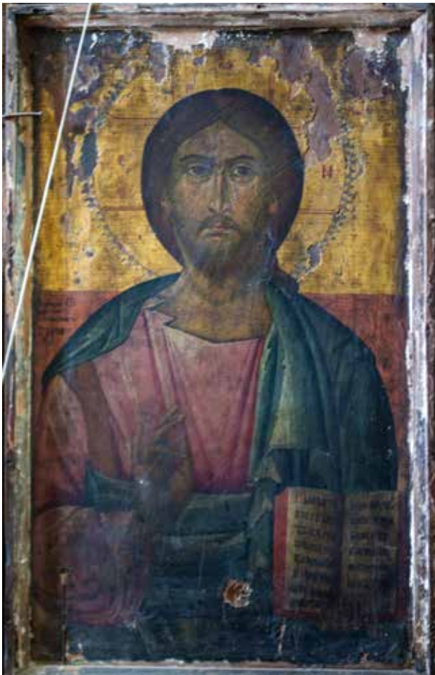
Сл. 1. Исус Христос, црквата Св. Никола во село Врбен, ок. 1790