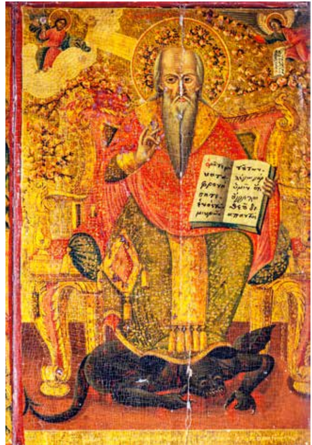
Сл. 8. Св. Василиј на трон, црквата Св. Никола во село Врбен

Во празничниот ред (втор) ред икони, според документацијата од НУ НКЦ – Скопје фалат две икони Благовештение о еβαγγελισμος της θεοτοκx, д.л. αφιερωμα μιανx 1835 μαιx α, (рег. бр. 7979, дим. 36x23x3,5 см.) и Рождество Христово η γεννησις тx χρισтx, д.л. αφιερωμα ιοакη 1835 μαιx α, (рег. бр. 7981, дим. 36x23x3,5 см.). На иконостасот сочувани се следните икони: Сретение, СРБТЕНІЕ ГДНА, η υλαπαντις тx χрстx, д.д. 1835, отворен свиток во раката на Ана: тато та φοεφοs ελοποεv, (рег. бр. 7942, дим. 36x23x3,5 см); Крштење Христово ΚΡΤΣΗΝΗΕ ΒΓΟΑΒΛΕΝІЕ η Βαπτιστις тx χρισтx, д.л. 1835, (рег. бр. 7980, дим. 36x23x3,5 см.); Преображение, ΠΡΕΟΒΡΑЖНІЕ / η μεταμορφωσις тx χρισтx, (рег. бр. 7956, дим. 36x23x3,5 см); Воскресение Лазарево, η ευερσις