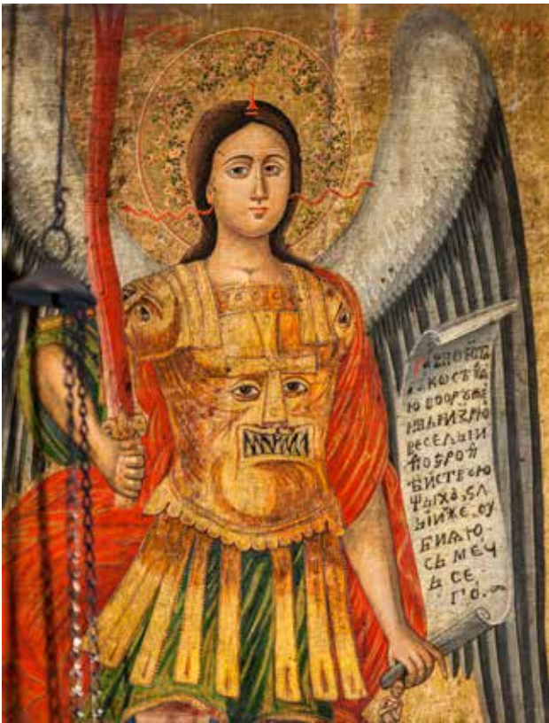
Сл. 5. Житијна икона на Св. Параскева, црквата Св. Никола во село Врбен