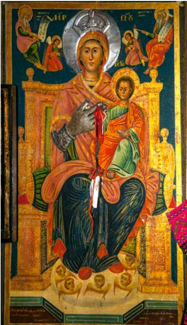
Сл. 15. Богородица со Христос со пророци, црквата Св. Атанасие во селото Ничпур

бр. 9045, дим. 37x27x2,5 см) 17 ; Воскресение Христово η αναστασις τх χριστх, (рег. бр. 9046, дим. 31x24x2,5 см); Воведение Богородичино во храм, (рег. бр. 9047, дим. 25x19x1,5 см) 18 ; Св. Сава и Варвара ο αγιος σαβαος / η αγια βαρβαρα, (рег. бр. 9048, дим. 25x19x1,5 см) 19 ; Св. Даниил ο προφитος δαν.ηλ., д.л.: 1846, (рег. бр. 9049, дим. 25x19x1,5 см); Архангел Михаил αρχανγελ.. μιχαηλ..., д.л.: 184. (рег. бр. 9050, дим. 31x21x2 см); Св. Јован Претеча СТЫН НСЯННЬ ПРАТЧЯ, текст на отворениот свиток во рацете на крстителот: ВНДАШ.. / ГЛАДЯ ТЕА / Ю НЕНСТОВ / СТЕО НРОДЯ / СБЛНЧЯ ІЕМЪ / НЕ ХО ТАВОНЕ / РА ТН ТНСА / ГЛАВУ С / БКАЕ ТЪ, Н / БОЖ ІЕ СЛО / ВО μετνο / ι τε γγγη / και ανερ η / βασιληων / τον χ ρυνων, Во долната лева половина три сцени една под друга: Второто пронаоѓање на главата на св. Јован Претеча; Христос кој го расчистува глумното Крштевање Христово и сцената Раѓањето