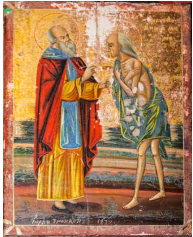
Сл. 12. Св. Зосим и Марија Египетска, црквата Св. Никола во село Белица

Од селото Бродец, во црква Св. Никола според документацијата од НУ НКЦ – Скопје имало (6) депонирани икони Распетие Христово, д. : 1837 (рег. бр. 7850, дим. 37x25x2,5 см); Св. Ѓорѓи , (рег. бр. 7855, дим. 38x30x2 см); Св. Никола ο αγιος νικολαος, (рег. бр. 7885, дим. 24x17x1,5 см); Исус