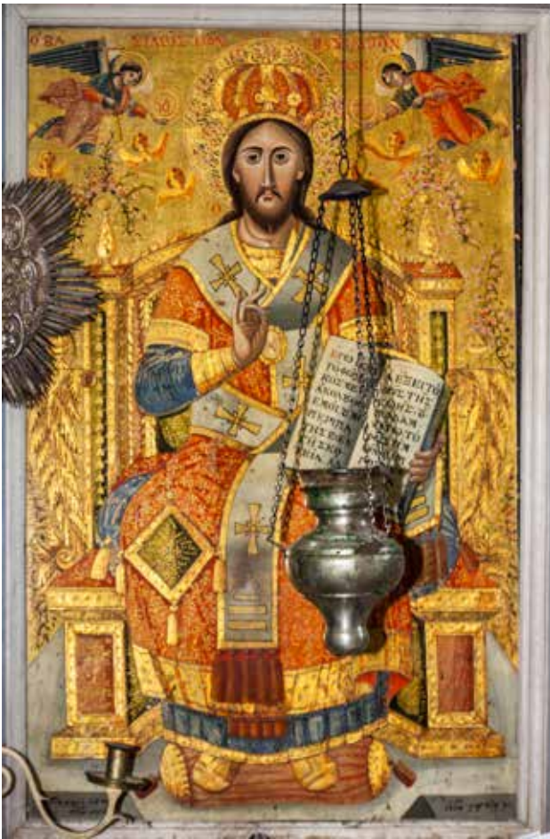
Сл. 3. Исус Христос, црквата Св. Никола во село Врбен