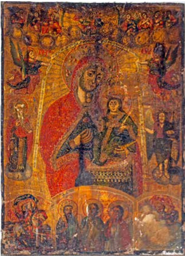
Сл. 21. Богородица несвенлива роза со светители, црквата Св. Архангел Михаил во с. Кракорница

ГЕСΩРΓΙΑ, ΦΗΛΩΒΗΤΙΑ, ΚΡΑΝ.ΟΒΣΚΙΑ 1847 αυθοστх 1; во долна зона во медаљони сцени од Чудата на св. Ѓорѓи: Светителот го испива отровот; Светителот мачен на тркало, Светителот закопан во ров; Светителот обува вжештени чизми; Усекование на св. Ѓорѓи (рег. бр. 7923, дим. 97x61x2,5 см) (сл. 20); Исус Христос ІС ХС, со четирите евангелисти г.л.: Матеј / μανθεος, г.д.: Јован / Ιω ο θεολογος, д.л.: Марко / μαρκου, д.д.: Лука / «λх; д.л.: 1847 ІЗЛІУ 25 / НЖДНВЕН / ІЕМЪ ГОСПО / ДННА ДЯ МІ / АНА Н БРАТЯ / ЕГΩ ГОСПОДНЪН и автограф РЪКА ХАЦІН АНАГНОСТЯ (покриен со рамка) (рег. бр. 7924, дим. 97x61x2,5 см); Св. Димитрие , (рег. бр. 7926, дим. 97x61x2,5 см); Задпрестолно Распятие Христово 21 ; Богородица со Христос 22 ; Деисис со други светители во долна зона, во долна зона: св. Димитрие на коњ (?), св. Никола / ο αγιος νικολαος, архангел Михаил / μηχαλ, св. Атанасиј / αθανασιος, непознат светител;