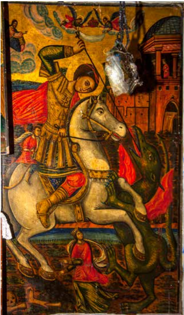
Сл. 9. Св. Ѓорѓи, црквата Св. Никола во село Бродец

д.д., приложнички натпис и автограф: ПРОШЕЊИЋЕ, РАБН/ БЖИЊ, ДИМЕТРИЈА И СЕРА/ ФИЈА ОБЪМА БРАТЈА/ НИКОВИЧН ѿ ВОЧКЕВС/ КИХЕ РОДЪ./ ЯСѦД : АВГУСТА ѿ/ ЗА РУКА ХАЧН АНАГНѦСТА. (рег. бр. 7991, дим. 100x67x2 см.) и други сцени со поеди- начни светители и теми: Воздвижение на крстот ВОЗДВИЖЕЊИЋЕ КРСТА / (ανάληψη) ...ωσις тх стаурх, д.д. 1835, (рег. бр. 7929, дим. 37x23x4 см); Света Троица СТЫА ТРЦЫ / η άγία τριας, д.д. 1835, (рег. бр. 7930, дим. 37x23x4 см); Св. Пантелејмон и св. Параскева СТЫА ПАНТЕЛЕИМОН - СТЫА ПАРАСКЕВА / η άγιος παντελεημον - η άγία Παρασκευη, ПАДНЛІ, д.д. 1835, (рег. бр. 7931, дим. 37x23x4 см); Вознесение на Св. Илија ПРРОКА ИЛИА / η πυργόρος άνάβασις тх профетх ηλιχ, д.л. 1835, натпис во раката на Св. Илија: Σεи κυριος και/ Σεи ηψυχη (рег. бр. 7932, дим. 37x23x4 см); Христос оди на волно страда- ние ІС ХС КРАЙНИИ СМЕРНОСТЬ / η ακρα ταλεινωσις, д.д. 1835 (рег. бр. 7971, дим. 36x22,5x3 см); Бого- родица со Христос, св. Ѓорѓи / о агиос γεωργιος и св. Димитриј / о агиос димитριος, св. Никола / о агиос νικολαος, св. Јован Претеча / о агиос Ιω προδρομου