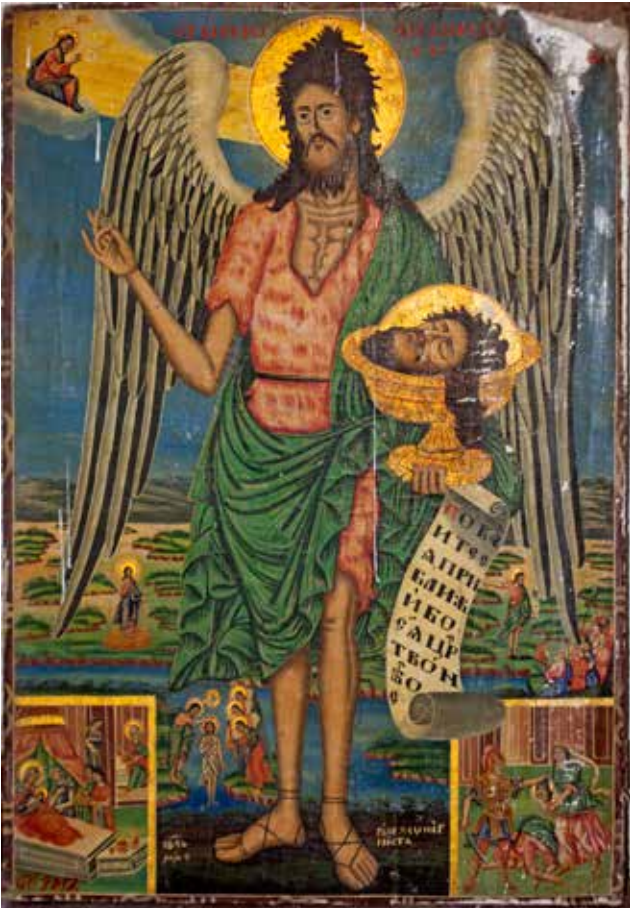
Сл. 25. Јован Крстител, црквата Св. Димитрија во село Богдево