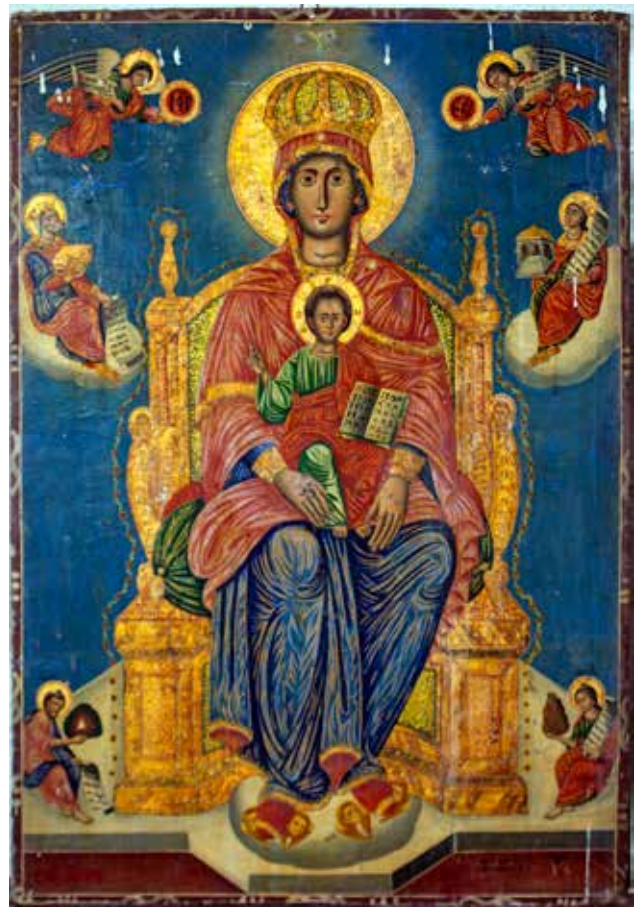
Сл. 26. Пророци те наговестиле, црквата Св. Димитрија во село Богдево

работени за различни иконостаси. Претставите на светителите, посебно кај престолните икони, сè дополнети со мноштво ликови (ангели, евангелисти, пророци), житијни сцени и декоративни барокни детали во сликањето на одеждите и црковниот мобилијар оплементи со масивна позлата. Ликовите се потенцираат со груб цртеж во кој се извлечени главните црти на широко отворените очи, силен нос и мали стиснати усни. Кај позадините знае да вметне пејзажи од морски брег исполнет со кипаруси и тоа што едновременно пишува билигвално на грчки и црковнословенски алудира на неговото потекло од беломорието.