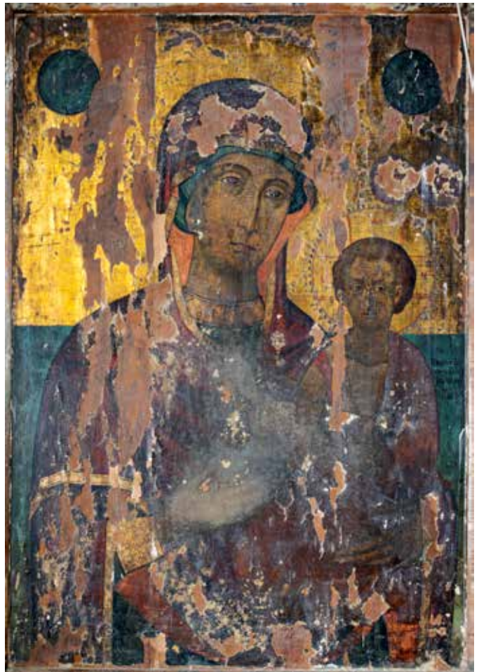
Сл. 2. Богородица со Христос, црквата Св. Никола во село Врбен, ок. 1790

раната Архангел Михаил од црквата Благовештение во Ставруполис. 5