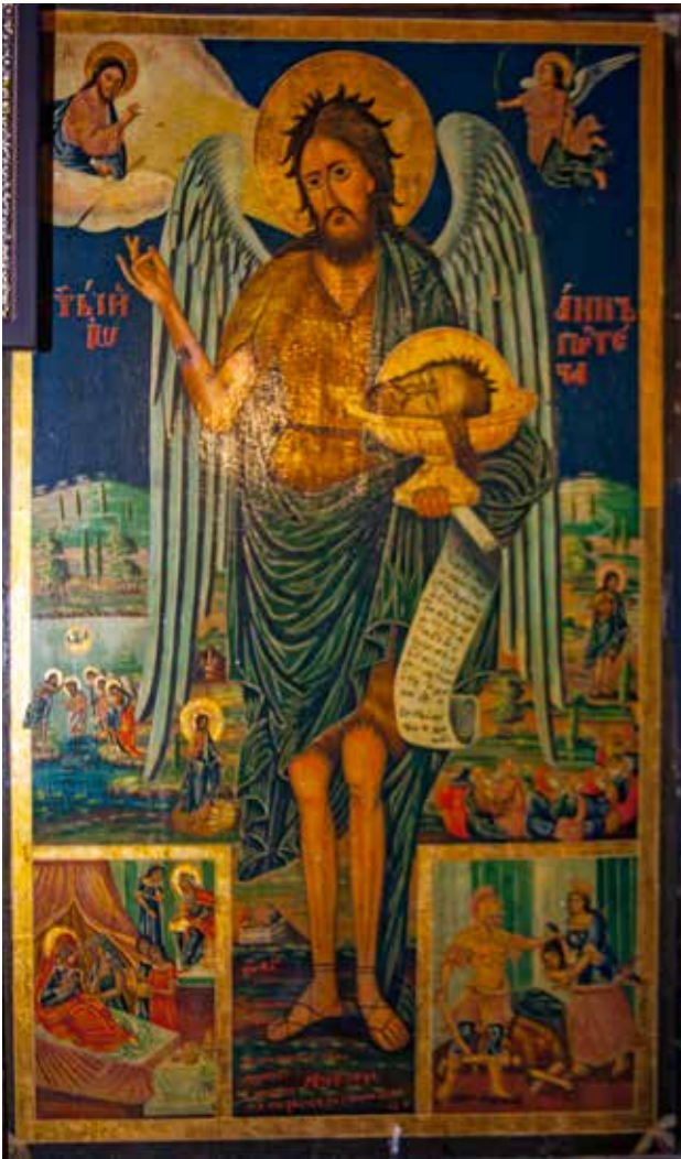
Сл. 13. Св. Јован Претеча, црквата Св. Атанасие во селото Ничпур

Евстатиј, СΤΗ ΕΥΣΤΑΘΙΗ, д.д. ΣΙΛΗΑΝ ΑΩΛΖ (нема досие) (сл. 10); Христос оди на волно страдание, ΙС ΧС / ΚΡΑΝΝΥΝ / ΣΜΗΡΕΝΟΣΤЬ, д.д. ΜΗΧΑΝΛЬ / ΞΑΝΤΡΗΑ (нема досие) (сл. 11)); Св. Зосим и Марија Египетска, ΑΒΒΑ ΖΟΣΙΜΙΑ / ΠΡΕΠΟΔΟΒΝΑ ΜΑΡΙΑ, д.с. ΗΟΡΗΝ ΖΜΕΝΚΟΝЬ 1837 (нема досие) (сл. 12);