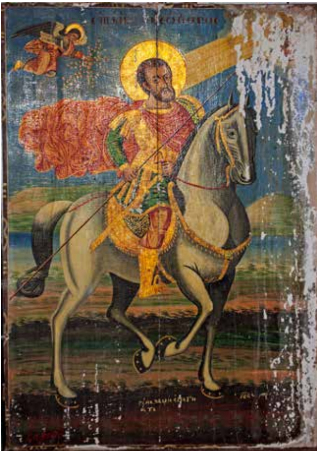
Сл. 23. Св. Теодор, црквата Св. Димитрија во село Богдево