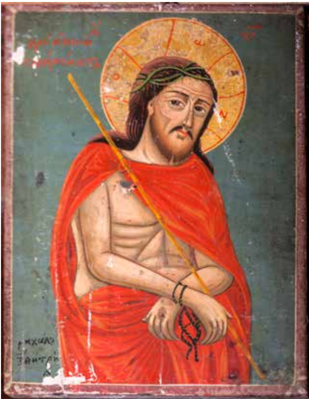
Сл. 11. Христос оди на волно страдание, црквата Св. Никола во село Белица

Κονσταντιν, η αγια Ελενα, д.д. 1835, (рег. бр. 7958, дим. 36x23x3,5 см); Св. Мина (?) и други светители, (рег. бр. 7961, дим. 34x28x2,5 см)