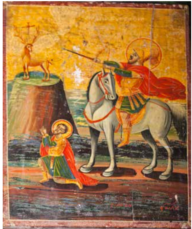
Сл. 10. Св. Евстатиј, црквата Св. Никола во село Белица

д.д., приложнички натпис и автограф: ПРОШЕЊИЋЕ, РАБН/ БЖИЊ, ДИМЕТРИЈА И СЕРА/ ФИЈА ОБЪМА БРАТЈА/ НИКОВИЧН ѿ ВОЧКЕВС/ КИХЕ РОДЪ./ ЯСѦД : АВГУСТА ѿ/ ЗА РУКА ХАЧН АНАГНѦСТА. (рег. бр. 7991, дим. 100x67x2 см.) и други сцени со поеди- начни светители и теми: Воздвижение на крстот ВОЗДВИЖЕЊИЋЕ КРСТА / (ανάληψη) ...ωσις тх стаурх, д.д. 1835, (рег. бр. 7929, дим. 37x23x4 см); Света Троица СТЫА ТРЦЫ / η άγία τριας, д.д. 1835, (рег. бр. 7930, дим. 37x23x4 см); Св. Пантелејмон и св. Параскева СТЫА ПАНТЕЛЕИМОН - СТЫА ПАРАСКЕВА / η άγιος παντελεημον - η άγία Παρασκευη, ПАДНЛІ, д.д. 1835, (рег. бр. 7931, дим. 37x23x4 см); Вознесение на Св. Илија ПРРОКА ИЛИА / η πυργόρος άνάβασις тх профетх ηλιχ, д.л. 1835, натпис во раката на Св. Илија: Σεи κυριος και/ Σεи ηψυχη (рег. бр. 7932, дим. 37x23x4 см); Христос оди на волно страда- ние ІС ХС КРАЙНИИ СМЕРНОСТЬ / η ακρα ταλεινωσις, д.д. 1835 (рег. бр. 7971, дим. 36x22,5x3 см); Бого- родица со Христос, св. Ѓорѓи / о агиос γεωργιος и св. Димитриј / о агиос димитριος, св. Никола / о агиос νικολαος, св. Јован Претеча / о агиос Ιω προδρομου