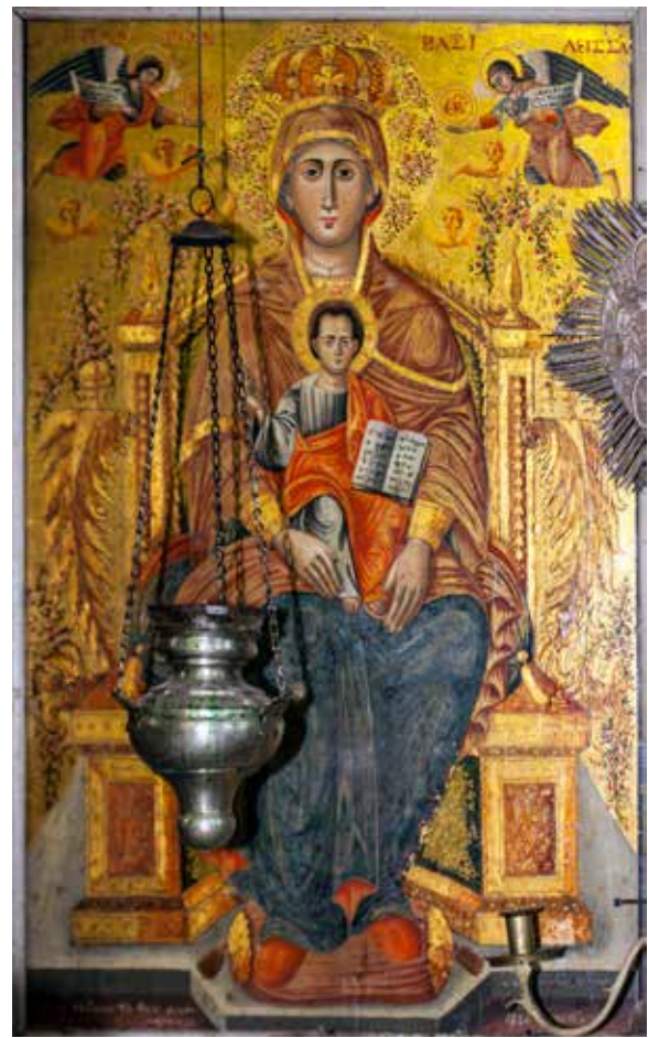
Сл. 4. Богородица со Христос, црквата Св. Никола во село Врбен