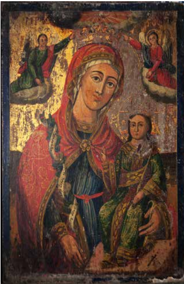
Сл. 27. Пророци те навестиле, црквата Успение Богородичино во селото Нистрово