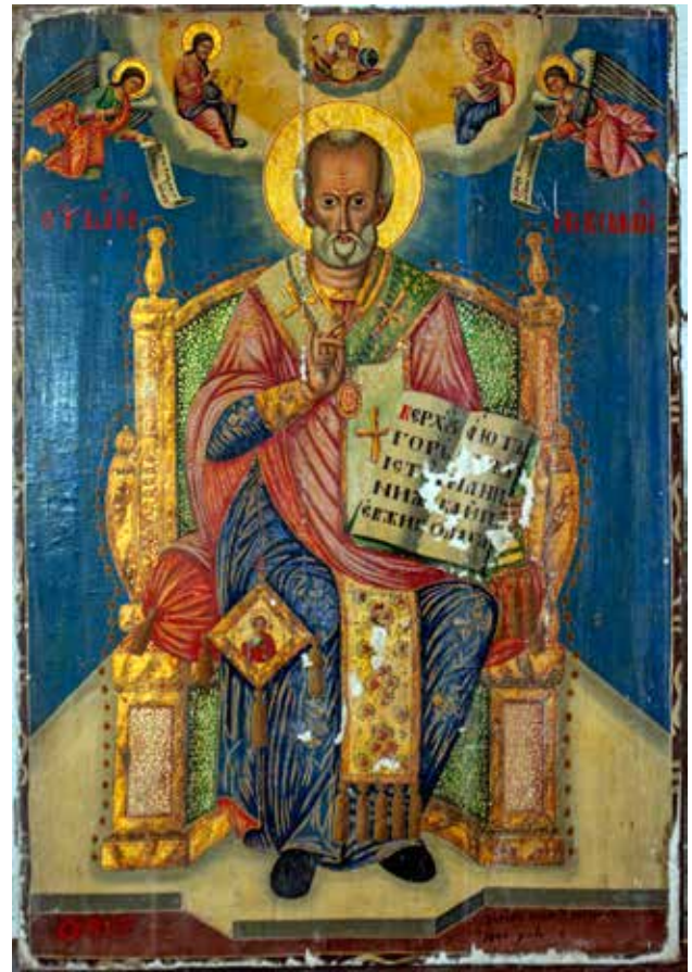
Сл. 22. Св. Никола, црквата Св. Димитрија во село Богдево

(сл. 22); Св. Теодор СТЫН ФЕΩΔΩΡΟΣ, д.д.: Зя РЪКА ХАЦІН: АНАГНОСТЯ 1852 МАІУ 26 (рег. бр. 9008, дим. 103x74x3 см.) (сл. 23); Исус Христос ІС ХС, со четирите Матеј / μανθεος, Марко / μαρκου, Лука / λхкас, Јован / Ιω; д.д.: 1852 МАІУ 8 / Х: АНАГНОСТУ (рег. бр. 9009, дим. 103x74x3 см.) (сл. 24); Св. Јован Претеча СТЫН НΩΑΝЪ ПРЕДТЕЧЪ, д.с.: сцена Христос на гумното, / д.с.: Проповед на св. Јован Претеча: Крштевање Христово; д.л.: сцена Раѓањето на св. Јован Крстител / 1852 МАЈУ 5 / д.д.: сцена Усекованието на главата на Јован Крстител / д.д.: РЪКА ХАЦІН: АГ / НОСТЯ (рег. бр. 9012, дим. 100x75x3 см.) (сл. 25); Воскресение Христово БОСКРЕСЕНІЕ ХРНСТВО (рег. бр. 9021, дим. 37x27x2 см.); Преображение Христово ПРЕОБРАЖЕНІЕ ХРІСТОВО / η μεταμορφωσις τх χριστх (рег. бр. 9022, дим. 31x27,5x3 см.); Крштевание Христово БОГОΑΒΛЕНІЕ ХРНСТВО / η Βαπτισις τх χριστх ; д.л.: 1852 ЈуЛІ 3 (рег. бр. 9023, дим. 37x26x2 см.); Раѓањето Христово РОЖДЕСТВО ХРІСТОВО, д.д.: 1852 НЗАНУ 18 (рег. бр. 9024, дим. 37x27x3 см.); Собор на апостоли СТЫХЪ СОБОРЪ АПОСТОЛСКНХ, д.с.: 1852 АУГУСТУ 16