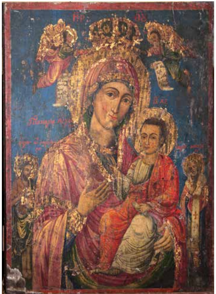
Сл. 28. Богородица со Христос, црквата Успение Богородичино во селото Нистрово