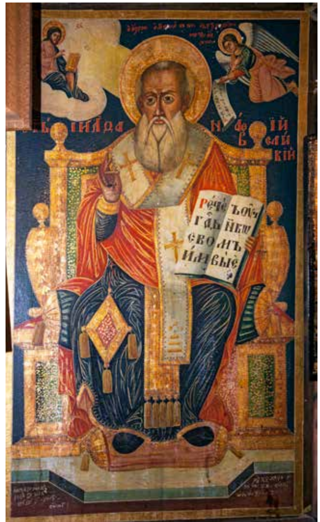
Сл. 14. Св. Атанасие, црквата Св. Атанасие во селото Ничпур

дим. 31x24x2,5 см); Св. Зосим и Марија Египетска αββα Ζοσιμας / ι αγια maria, (рег. бр. 9035, дим. 31x24x2,5 см); Преображение η μεταμορφοσις тx христx, (рег. бр. 9036, дим. 31x24x2,5 см); Воведение Богородичино та εισοδια της θεοτοκx, (рег. бр. 9037, дим. 31x24x2,5 см); Христос оди на волно страдание ΙС ΧС η акра тапηνοσις (рег. бр. 9038, дим. 31x24x2,5 см); Св. Константин и Елена о агιος Κωνσταντινος, η αγια Ελενα (рег. бр. 9039, дим. 31x24x2,5 см); Св. Недела (?) и Параскева, д.с.: 1846 (рег. бр. 9040, дим. 25x19x2 см) 12 ; Св. Теодор Тирон о агιος θεοδορος, (рег. бр. 9041, дим. 25x19x2 см) 13 ; Исус Христос ΙС ΧС, (рег. бр. 9042, дим. 25x19x2 см) 14 ; Св. Димитрие, (рег. бр. 9043, дим. 25x19x2 см) 15 ; Св. Ефтимий, д.л.: 1846 (рег. бр. 9044, дим. 25x19x2 см) 16 ; Св. Јован Претеча / о агιος Ιωανις ο προδρομος, текст на отворениот свиток: μεταν.ειτε ηγγικε/ γαι η βασιλειος (рег.